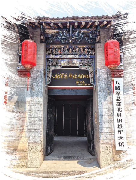
八路军总部北村旧址纪念馆

八路军将士绝不拿群众一针一线，是因八路军严明的纪律、一心为民的初衷。他们并不是物资充裕，生活富足。相反，当时他们面临的形势极其严峻，物资极度匮乏。可面对满村唾手可得的牛猪蛋粮，他们守护着等待主人归来。将士们宁愿夜宿街头也不推开一扇扇虚掩的门。八十多年过去了，在北村人民的口口相传或文字记录中，当时的场景仿若昨日。今天，他们以一部《情暖北村》的情景剧再现当时感人场景。