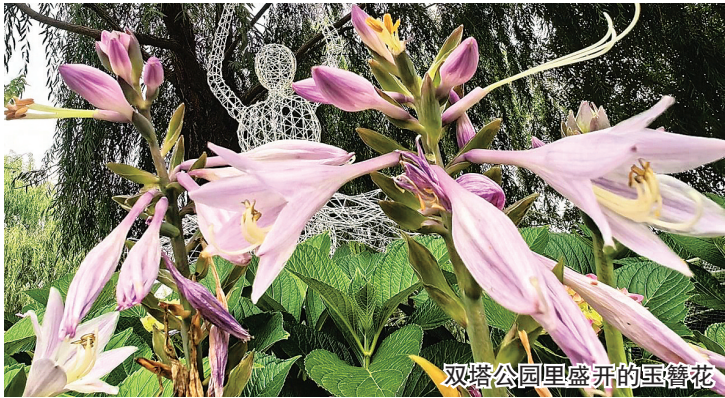
双塔公园里盛开的玉簪花