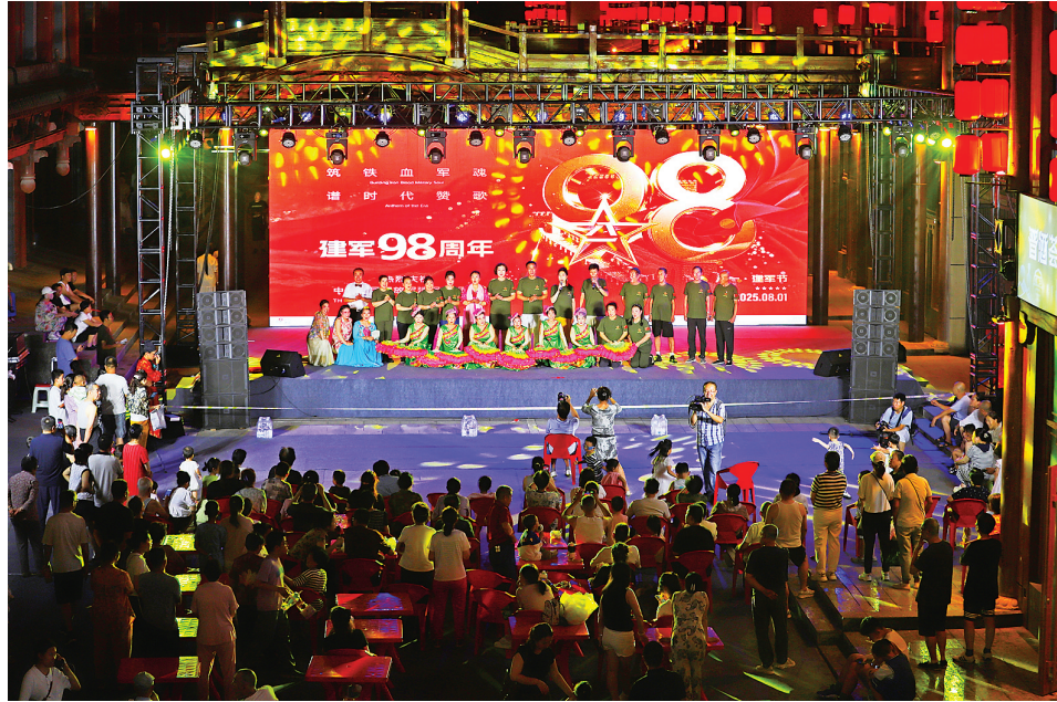
8月1日晚，由小店区商务局主办的薪火相传向未来——抱鼓巷“八一”主题消夏汇演活动在抱鼓巷举行。活动包括情景剧、舞蹈、朗诵、歌唱等。

特色文化内涵，此次活动也是探索让文物“活”起来、让文化“动”起来新路径的有益实践，通过持续开展此类兼具文化底蕴和时代气息的活动，太原市文物系统着力将丰富的文物资源转化为滋养公众精神世界、服务社会发展的宝贵财富。