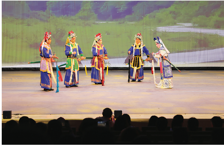
8月2日，由河南省文旅厅、郑州市人民政府主办的“豫晋相约 山河同游”河南文化旅游推广活动在山西大剧院举行，让市民沉浸式感受了中原戏剧魅力。郭苑甫 摄

意融合的童趣想象，让兔尊、牺尊等青铜器落于笔端，化作插满鲜花的花器，这些创作以最纯粹的方式诠释着艺术的本真。 展览特别设置观众互动区，观众领取彩色手工纸，折叠任意造型，为中央互动装置《光亮》注入个人印记，每个参与者的光芒在此汇聚，让艺术成为双向对话的桥梁。展览将持续至8月17日，其间，山西师范大学美术学院、山西省特殊教育中等专业学校、太原市盲童学校等，将在展厅开展教育共创系列活动。