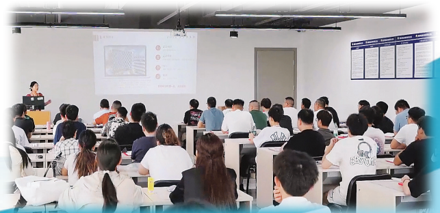
暑假期间,报名无人机飞手培训的年轻人明显增多,学员们认真学习相关法律法规、安全规范等。