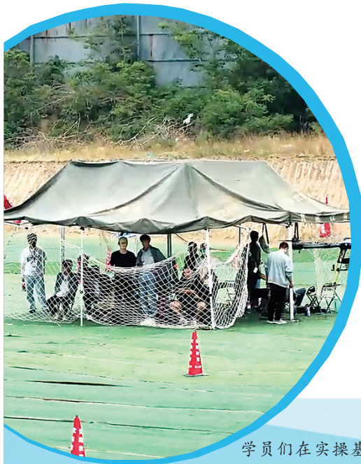
学员们在实操基地,练习起降、悬停、自旋等技术动作。