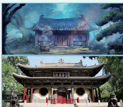
·山西省太原市晋祠水镜台