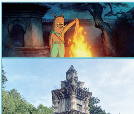
·山西省忻州市五台县佛光寺祖师塔