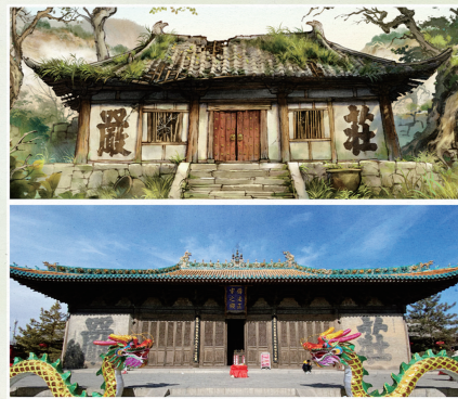
·山西省大同市浑源县永安禅寺