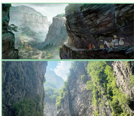
·山西省长治市壶关县太行大峡谷