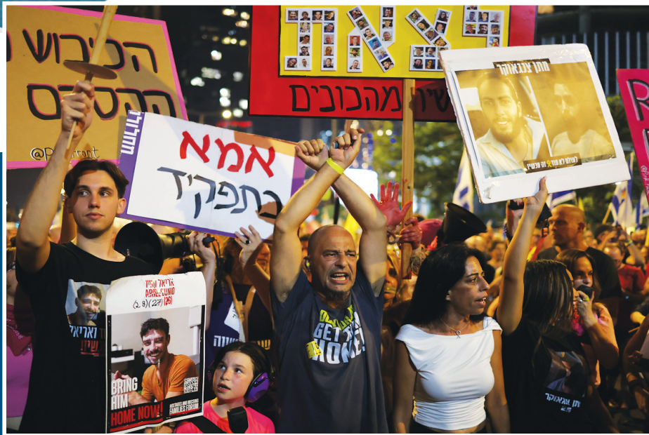
8月9日,以色列民众手持被扣押人员的海报在特拉维夫参加游行集会。

盖范围。 据巴西总统府消息,副总统阿尔克明将于8月底率领由商界领袖组成的代表团访问墨西哥,访问旨在拓展双方在农业、航空、制药等领域的合作。卢拉上月底与墨西哥总统辛鲍姆通话时建议,启动扩大巴墨贸易协定的谈判,强调两国进一步深化经贸关系的必要性。 巴西政府6日宣布,已提交在世贸组织争端解决机制下与美国进行磋商的请求,对美方根据其今年4月2日颁布的所谓“对等关税”行政令和7月30日颁布的“应对巴西政府对美国的威胁”行政令实施关税措施提出质疑。卢拉日前还表示,巴西正考虑联合其他国家向世贸组织提起联合申诉。 此外,巴西政府还致力于通过一系列国内政策来应对美国加征关税带来的经济冲击。路透社7日援引消息人士的话报道说,巴西政府正考虑从巴西国家经济社会发展银行管理的一项基金中拨出约300亿雷亚尔(约合55.4亿美元),以支持受到关税冲击的企业。卢拉近日还表示,巴西政府正在研究如何调整对美国企业征税,并计划制定一项有关战略矿产资源开发的新政策。 新华社巴西利亚8月9日电