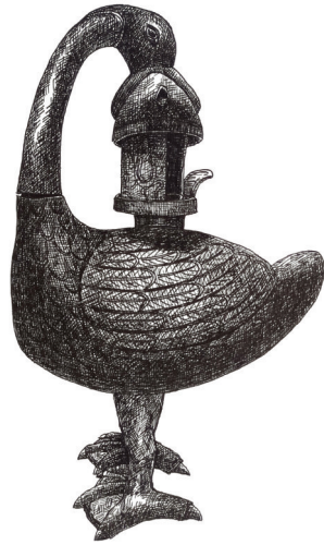
山西博物院藏雁鱼铜灯