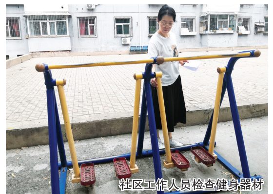
社区工作人员检查健身器材

社区工作人员告诉记者,小区里的健身器材常年处于露天环境,加之使用率高,部分器材出现螺丝松动或零件