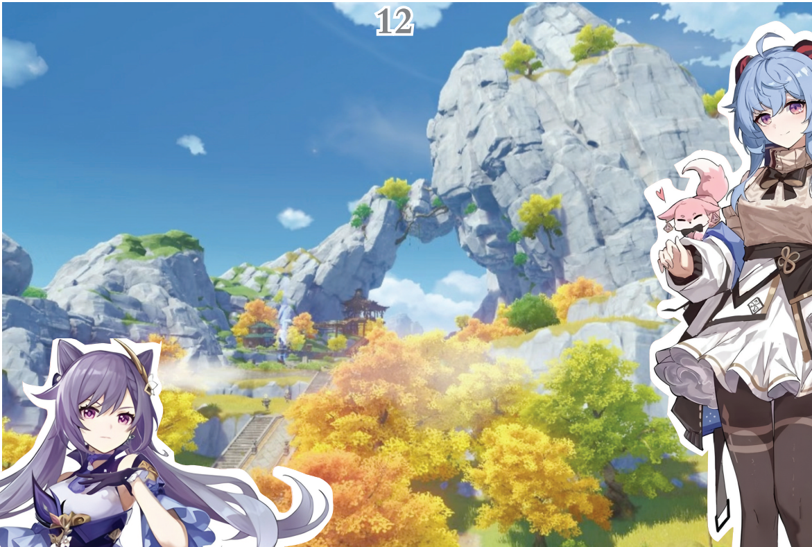
原神取景地之天门山