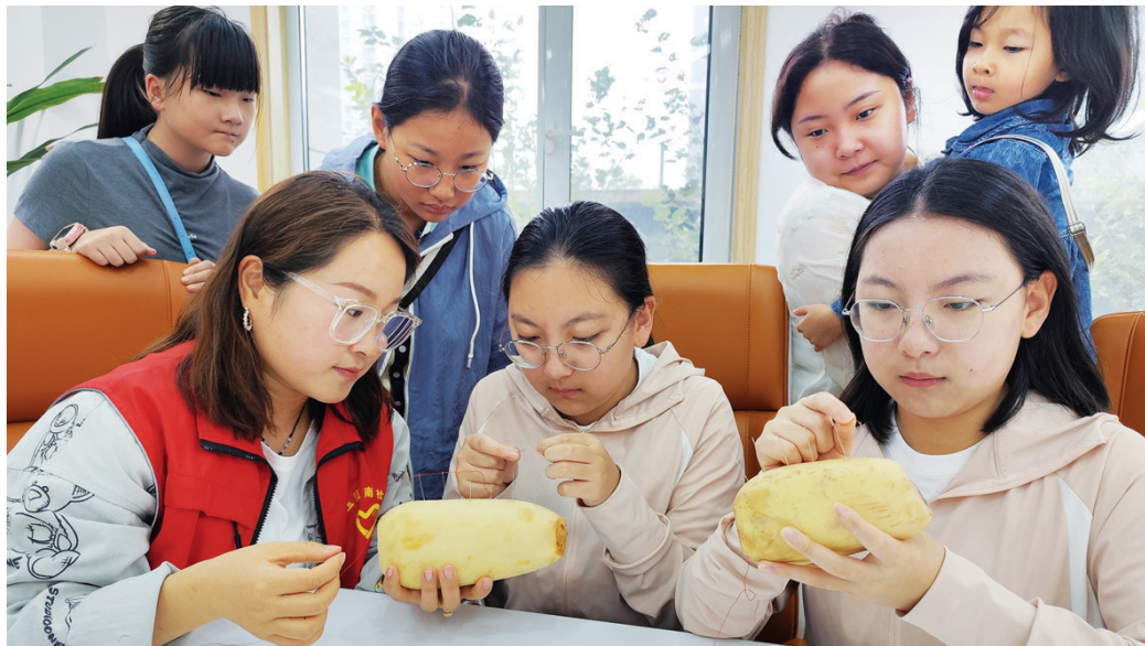
玉园南社区举办穿针乞巧体验活动

七夕将至,浪漫活动多了起来。举办一场中式婚礼,或拍一组汉服写真;到社区体验穿针乞巧习俗,或诵读七夕经典诗句。连日来,在浪漫色彩逐渐拉满的同时,也掀起了一波国潮风,吸引更多人了解并爱上传统文化。