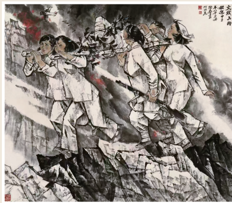
《火线上的姐妹》杨力舟 王迎春 绘

作者以概括有力的线条将抗战中妇女的昂扬激情表现得淋漓尽致,以块面和粗线条勾连的山势、崎岖的山道与画面中人物的身体倾向将观者的视线引向斜上方,背景中弥漫的硝烟战火以及飞溅的红色突出了作品的主题,也让人不由得被画面中妇女们勇敢、坚强、沉着的精神所感染。有意味的是,在表现画面的主体人物和背景的战火时,画家没有做过多的矫饰,而是以极快速度的笔线挥洒而成,而这些充满力量的笔线成功塑造了奔忙于战场的妇女身影。