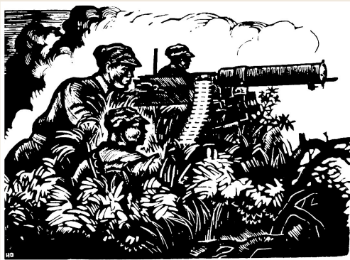
《抗战》力 群 作