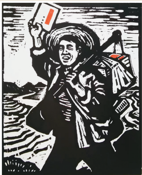
《红色宣传员王翻身》王 旻 作

《人民在暴风雨中》收藏在太原美术馆(太原画院),该作品构图严谨,以细腻写实的手法刻画出准确、生动的人物形象,黑、白、灰布局有致,刀法在统一中求变化,从而真实地再现了农村暴风雨来临时的情景。