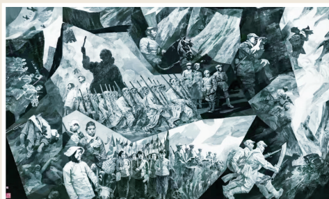
《太行烽火》杨力舟 王迎春 绘

这幅巨构选择了传统的六条屏样式,以日军入侵华北进入太行山为叙事起点展开了波澜壮阔的人民战争场景叙事。在水墨语言上,他们着重解决山与人的超时空组合,将太行山作抽象化处理,用耸立的山势构成立体块面,强化画面视觉冲击力,从而衬托出人物动态。在人物塑造上,既有借鉴和运用北宗山石皴法的雄强笔墨,按结构处理光影明暗,强化黑白对比,又用极为感性的线条勾画人物,如数十位男女民兵的形象就纯以线条造型,强调率意书写的绘画性,泼墨、勾勒和剪切、拼贴相结合,将水墨语言的表现力发挥得淋漓尽致。