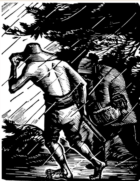
《人民在暴风雨中》力 群 作