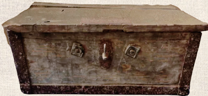
平型关战斗缴获的日军子弹箱