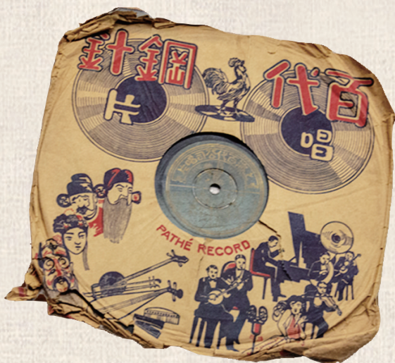
1935年，上海百代唱片公司出版的电影《风云儿女》主题曲唱片《义勇军进行曲》