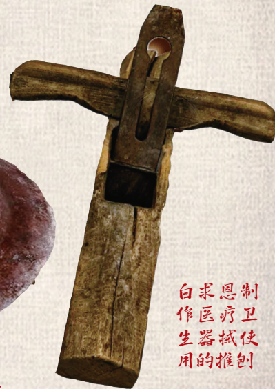
白求恩制作医疗卫生器械使用的推刨