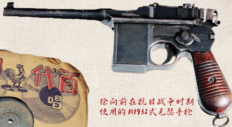
徐向前在抗日战争时期使用的M1932式毛瑟手枪