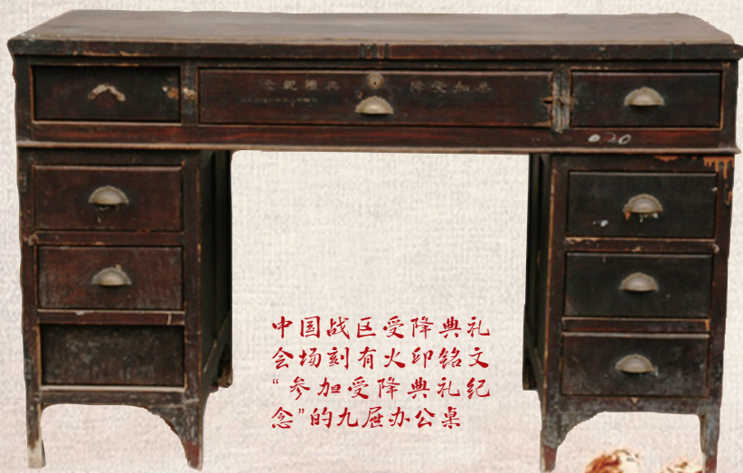
中国战区受降典礼会场刻有火印铭文“参加受降典礼纪念”的九层办公桌