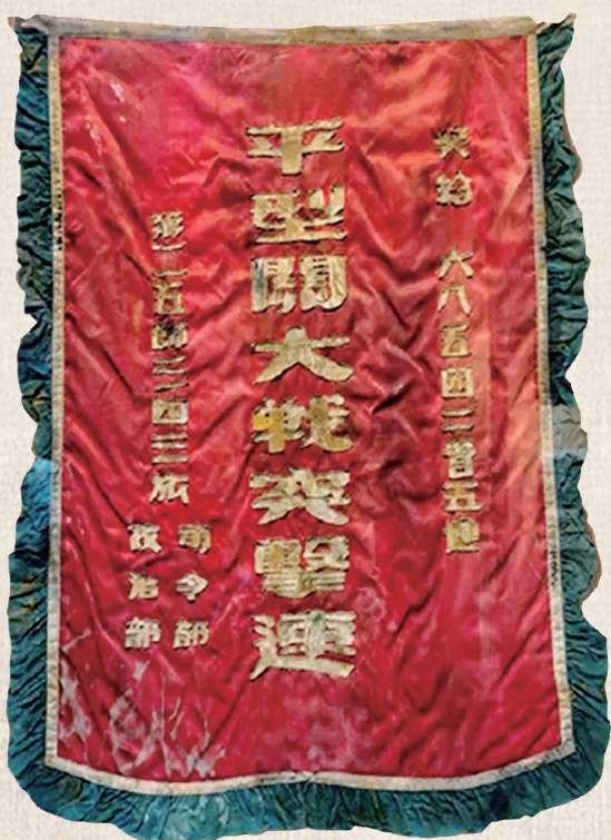
“平型关大战突击连”锦旗

文物无声，承载着永不磨灭的民族记忆，照见气壮山河的精神丰碑。每一件抗战文物都是抗战烽火的见证，蕴藏着中华民族英勇不屈的民族精神。让我们一同触摸历史的记忆，从抗战文物中感悟伟大抗战精神、汲取团结奋斗力量，在新的征程上奋勇向前。