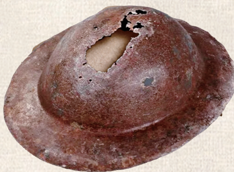
卢沟桥事变时，宛平城守城部队第29军战士使用过的铜盔