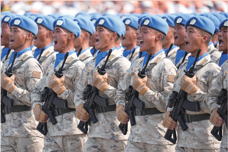
维和部队方队接受检阅