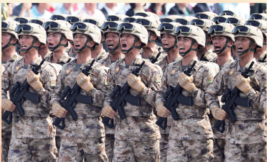
联勤保障部队方队接受检阅

仪仗方队护卫党旗、国旗、军旗，9月3日上午第一个走过天安门广场，接受祖国和人民检阅。 铁流滚滚，战旗猎猎。接受检阅的80面战旗，从全军各部队遴选确定，来自东、南、西、北、中五大战区，涵盖陆、海、空军和武警部队，由团、营、连三级功勋荣誉单位代表组成。 代表全国广大基干民兵和普通民兵，肩负着展示新时代民兵风采重任的民兵方队，全部由女民兵组成。这是民兵首次亮相以纪念抗战胜利为主题的阅兵活动。民兵是中国“三结合”武装力量的重要组成部分。 头戴蓝色贝雷帽、脖系蓝色丝巾的维和部队方队，既是对抗战胜利的隆重纪念，又展现了中国履行国际义务、维护世界和平的大国担当。从1990年首次派出5名军事观察员开始，中国军队参与联合国维和行动已经35年，累计派遣超过5万名维和官兵。中国蓝盔已经成为联合国维和行动的关键力量。 据新华社北京9月3日电