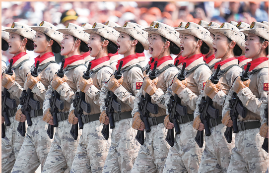
民兵方队接受检阅