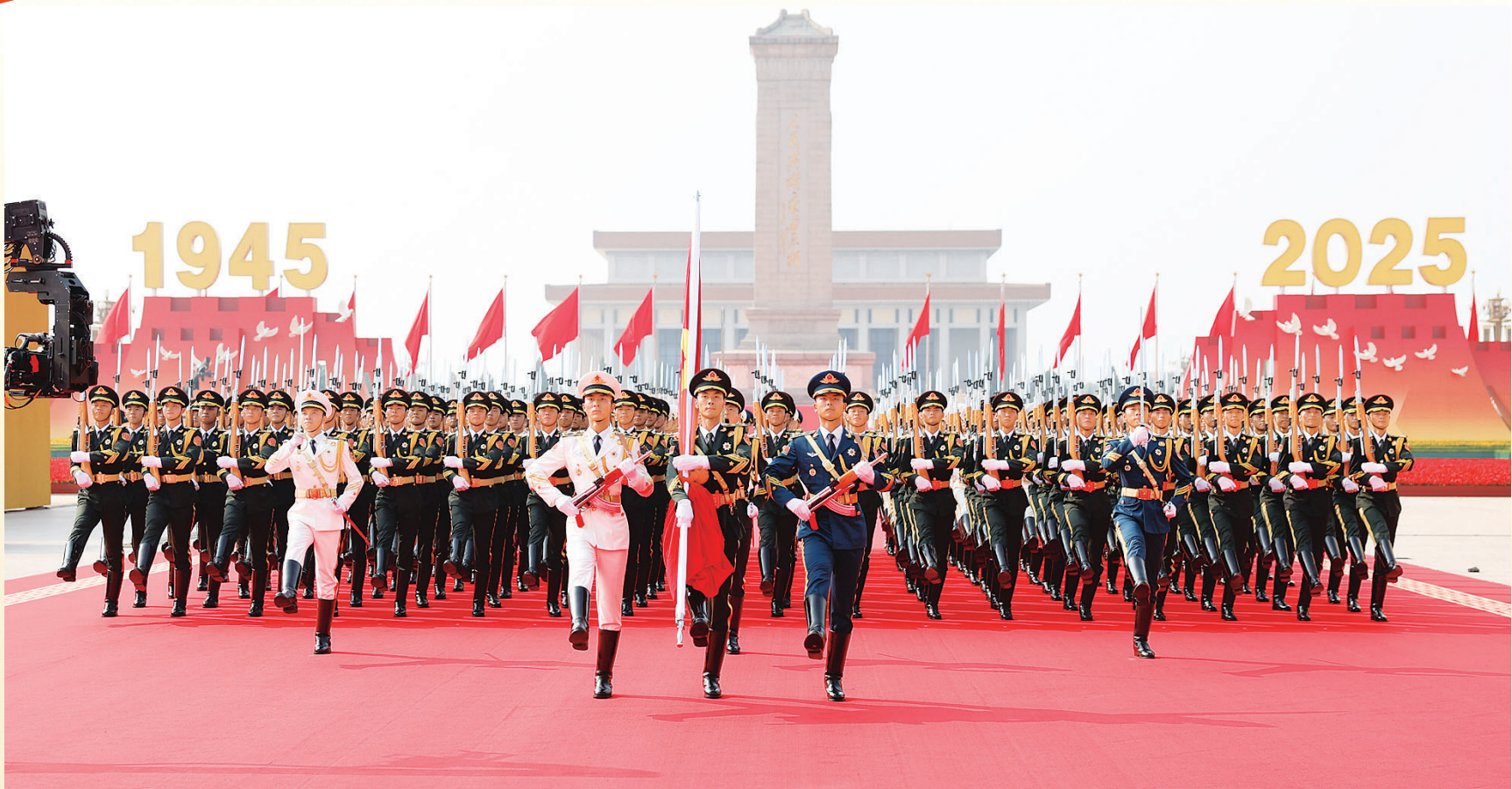
国旗护卫队在行进中