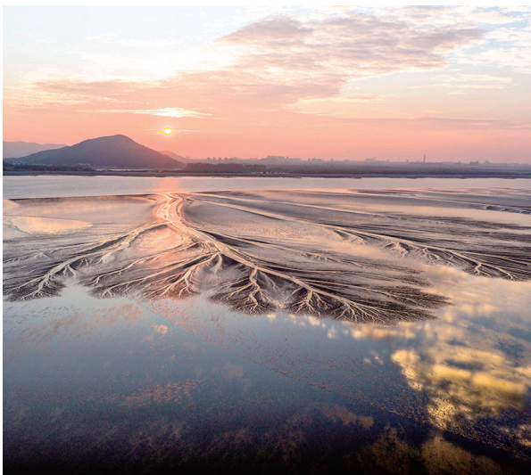
每年农历八月月中下旬,浙江钱塘江大潮都会呈现“海阔天空浪若雷”的壮丽奇观。大潮过后,潮滩上形成形态各异的“潮汐树”景观,为观众观潮增添趣味。

如何更好地观赏这一幕“星月童话”?“如果天气晴好,只需面向东方天空,寻找一个视野开阔之地,微微抬头即可看到。除裸眼观测外,有条件的公众使用双筒望远镜或小型天文望远镜观测,还可以清楚地看到木星的一些细节,如两条云带等。”刘仲利说。