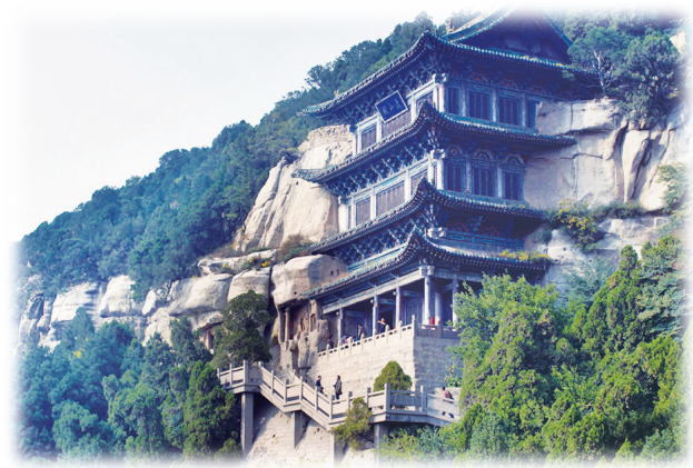
天龙山石窟（资料图）

嫩蚕豆可以益气健脾，利湿消肿。它还含有大脑和神经组织的重要组成成分脑磷脂和丰富的胆碱，有增强记忆力、健脑的作用。此外，蚕豆是低热量的食物，对高血脂、高血压和心血管疾病的患者来说，是很优质的绿色食品。