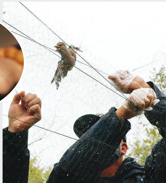
2025年10月19日，哈尔滨野保志愿者团队志愿者在救助被捕鸟网粘住的鸟类。