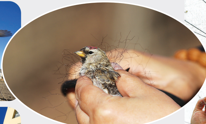
中图：哈尔滨野保志愿者团队志愿者在剪掉缠在白腰朱顶雀身上的鸟网(2019年11月2日摄)。