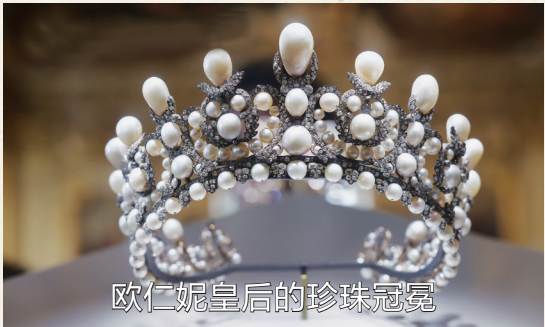
欧仁妮皇后的珍珠冠冕

1853年欧仁妮与拿破仑三世婚礼后不久,珠宝商受委托使用法国王室收藏的珍珠和钻石制作了这枚冠冕、皇冠和大胸针的珠宝组合。这顶珍珠冠冕即属于欧仁妮皇后,由212颗珍珠,1998颗钻石,与银镀金框架组成。