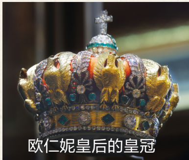
欧仁妮皇后的皇冠

这件文物被盗后遗落在卢浮宫外,目前信息是有损伤,具体损伤情况还不清楚。这是拿破仑三世的妻子欧仁妮皇后的皇冠,由2490颗钻石,56颗祖母绿制成。