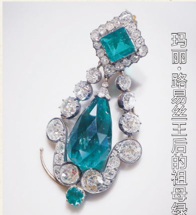
玛丽·路易丝王后的祖母绿耳环

项链属于法国皇帝拿破仑一世的第二任妻子玛丽·路易丝王后。项链由32颗祖母绿(其中10颗为水滴形),1138颗钻石组成。