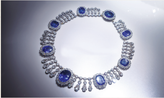
玛丽·阿梅莉王后的蓝宝石项链

玛丽·阿梅莉王后是法国国王(1830年至1848年)路易·菲利普的妻子,这顶头冠由斯里兰卡蓝宝石、钻石、黄金制成。