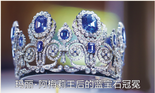
玛丽·阿梅莉王后的蓝宝石冠冕

玛丽·阿梅莉王后是法国国王(1830年至1848年)路易·菲利普的妻子,这顶头冠由斯里兰卡蓝宝石、钻石、黄金制成。