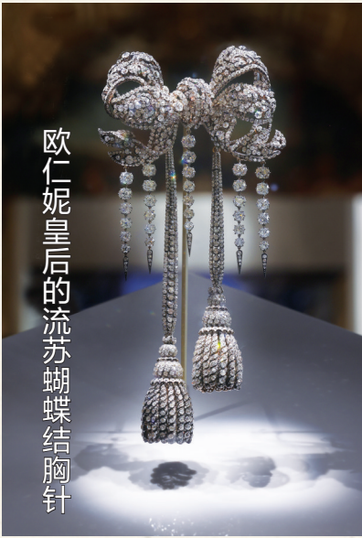
欧仁妮皇后的流苏蝴蝶结胸针

1853年欧仁妮与拿破仑三世婚礼后不久,珠宝商受委托使用法国王室收藏的珍珠和钻石制作了这枚冠冕、皇冠和大胸针的珠宝组合。这顶珍珠冠冕即属于欧仁妮皇后,由212颗珍珠,1998颗钻石,与银镀金框架组成。