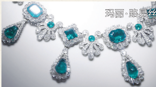
玛丽·路易丝王后的祖母绿项链

这也是一件非常著名的胸针,名字来源于胸针上使用了多颗来历渊源的宝石:上方两颗硕大的粉红色钻石组成蝴蝶结。由1661年红衣主教Mazarin遗赠给路易十四的18颗Mazarin钻石系列中的两颗。胸针下部的水滴形钻石是路易十四背心上的第四颗纽扣,后来又成为了“断头皇后”玛丽·安托瓦内特的耳环。