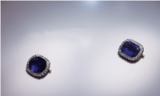
玛丽·阿梅莉王后的蓝宝石耳饰