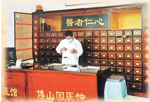
傅山国医馆工作人员正在抓药

从书籍中来，在实践中发扬光大。从用文字书写的《傅青主女科》到变成医学技艺的傅青主女科，中国一代代医学者，正通过自己的努力，让传统医学始终散发着迷人的光芒。