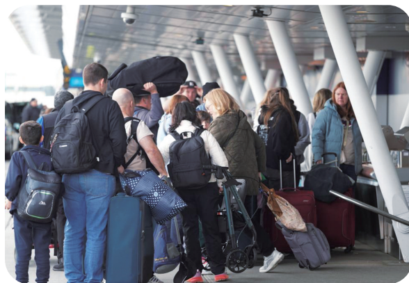
11月5日,在美国纽约肯尼迪国际机场,乘客排队值机。