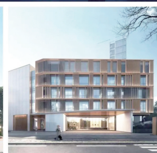
筹备中的龙城医养大厦