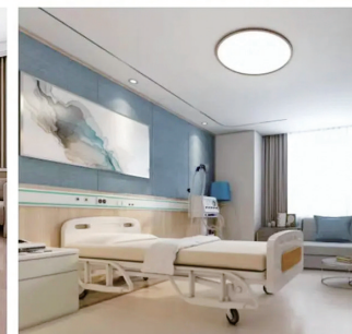
纺织苑老年幸福院内景