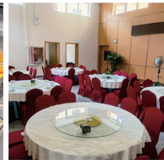
纺织苑社区食堂实景