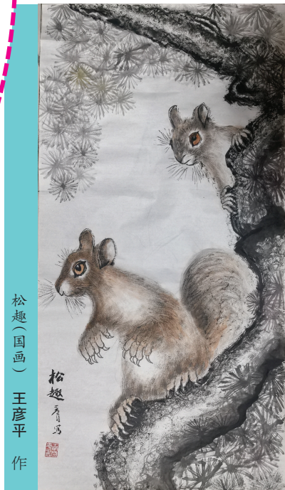
松趣(国画) 王彦平 作

全诗章法严谨，语言凝练，对仗工整，意境深远，充分体现了作者对传统文化的深厚热爱及对晋商精神的深刻理解。