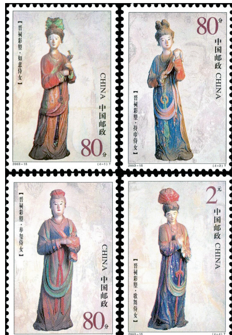
《晋祠彩塑》特种邮票