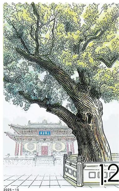
中国邮政 CHINA 山西晋祠国槐

一枚枚小小的邮票，将晋祠的古树风姿与彩塑神韵展现得淋漓尽致。晋祠之美，在邮票中定格，吸引更多人走进晋祠，领略它的无穷魅力。