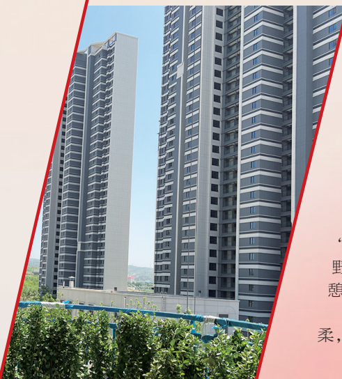
第四代住宅东山森林庭院项目外景