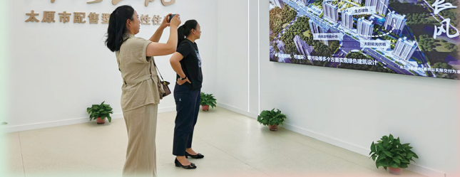
配售型保障性住房锦绣长风项目楼盘现场