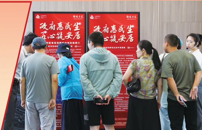
市民在了解配售型保障性住房申请流程

“十四五”期间，我市深化住房和房地产领域改革，加快构建房地产发展新模式，完善住房供应体系，改革完善房地产开发、融资、销售等基础性制度，建立人、房、地、钱要素联动新机制。截至目前，全市已有11个保障性租赁住房项目投入运营；配售型保障性住房首个项目完成选房，第二个项目18栋主体全部封顶；好房子建设提上日程，绿色建筑、超低能耗、层高不低于3米、全屋精装成为标配。