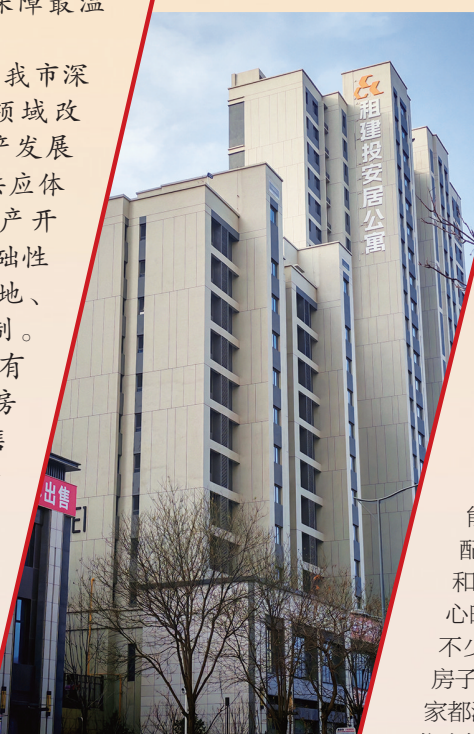
租建投安居公寓赞城社区外景