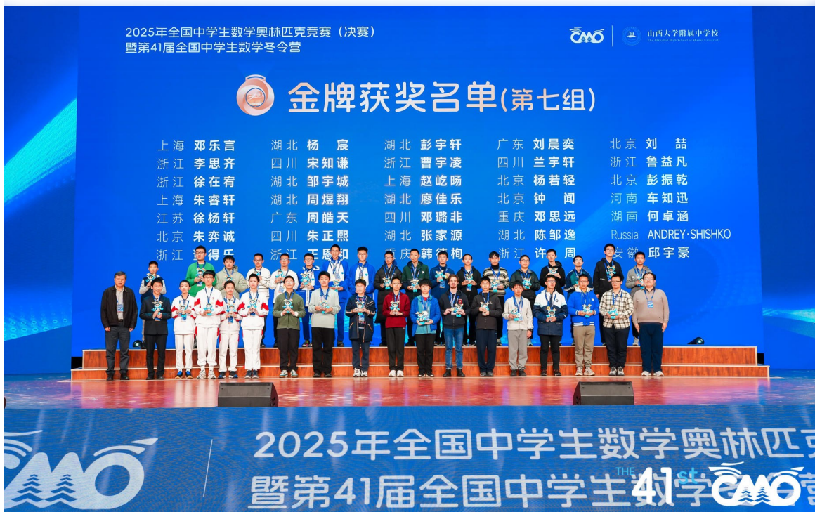
入选国家集训队部分成员