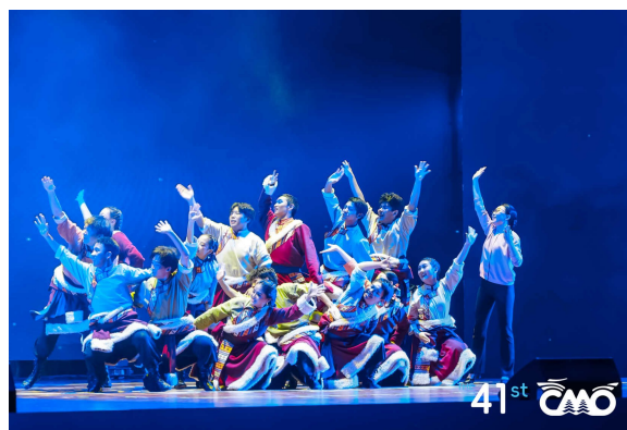
开幕式上山西大学附属中学西藏班学生带来的原创舞蹈《窗语·格桑》