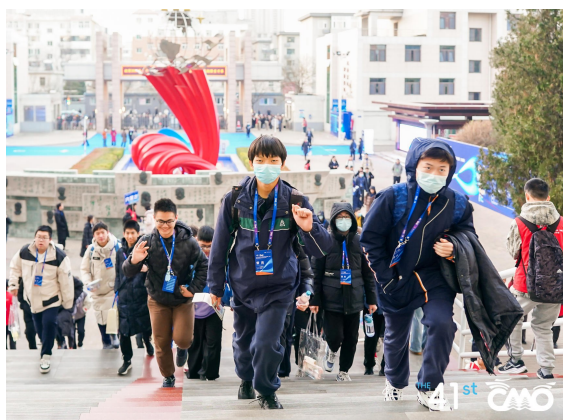
来自各地的选手入场