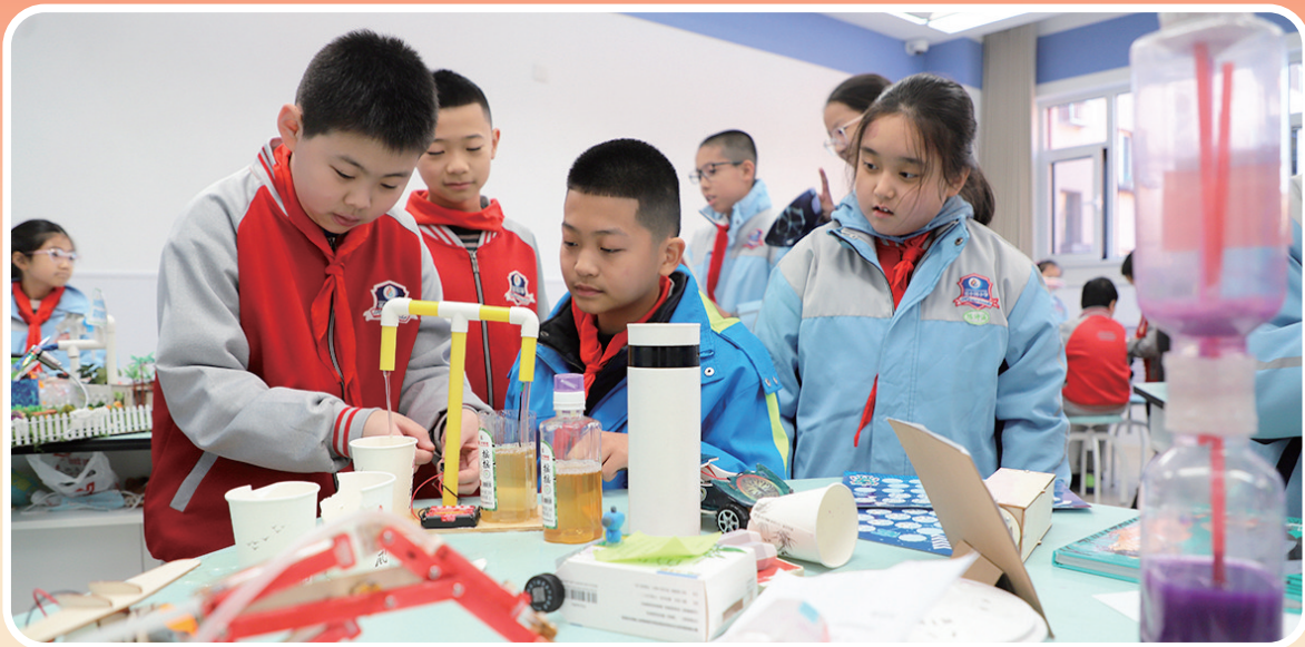
后小河小学教育集团科技嘉年华活动。