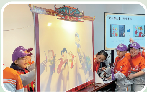
小店区实验小学四年级学子走进孟母故里。