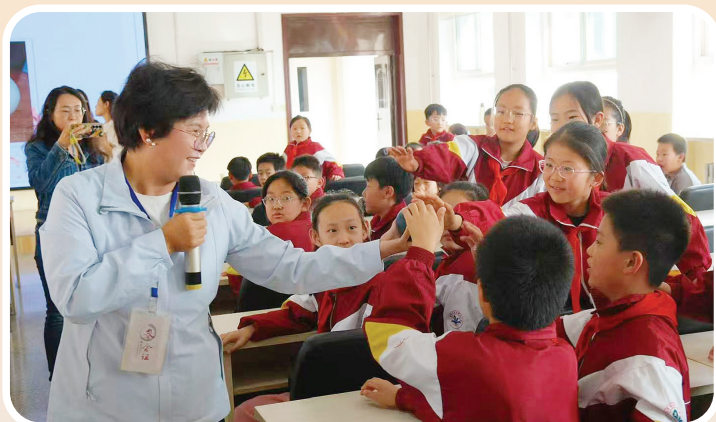
“山西科学讲坛”走进新西小学。