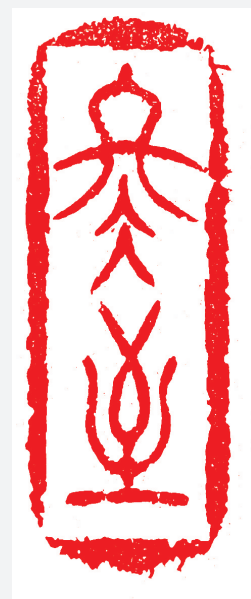
冬至(篆刻) 李泽峰 作