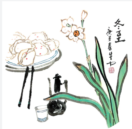
冬至(水墨画) 牛力 绘