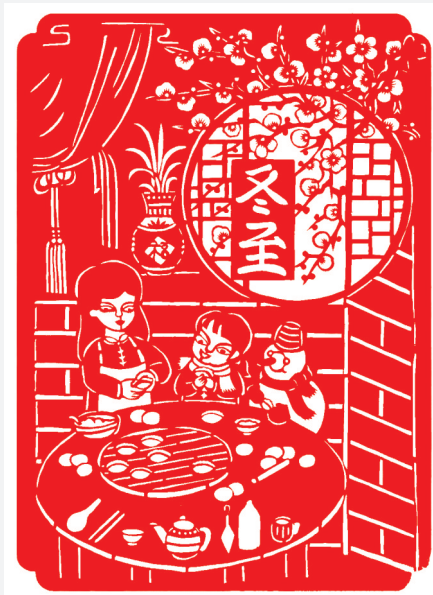
冬至(剪纸) 徐树斌 作