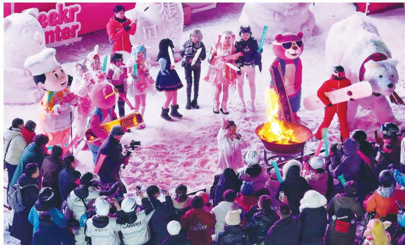
年轻人们体验采薇庄园滑雪场的嘉年华活动

一家人围坐，涮羊肉、吃饺子，聊一聊生活日常；年轻人相约，坐上高铁，跟着节气去旅游；短途自驾，到周边泡温泉，享受惬意时光；燃起篝火，跟着音乐节奏，尽情释放压力。今年冬至恰逢周末，不少市民安排了丰富多样的活动，体验充满仪式感的快乐，也给传统节气增添了新韵味。