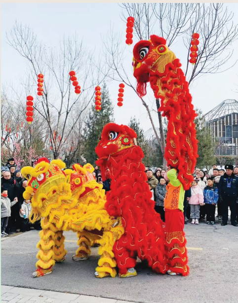
太原动物园举办的太原庙会

从这一份亮眼的成绩单可以看出,近年来,我市公园绿地建设以完善布局、丰富类型、提升功能为重点,全市“一盘棋”统筹推进,在城市东部新建了和谐公园、双塔公园、晋阳街公园,在太原火车站、太原南站等人流密集区新建了多处广场绿地;南部建成了晋阳湖公园、太原植物园、昌宁公园、晋源新区体育公园等;西部建成了和平公园、滨河体育公园、南寒公园等;北部建成了金桥公园、摄乐公园、小东流公园、新村公园、迎新公园、老龙头景区等。此外,九河沿线带状公园、绿地如同一条条横贯城市的花带,蜿蜒流转。遍布全市各个角落的游园绿地、口袋公园更是如同市民自己的花园,星罗密布。