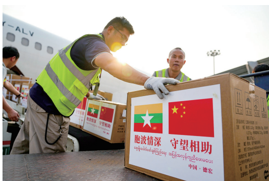
▲2025年4月1日,云南省德宏傣族景颇族自治州人民政府通过航空方式向缅甸卫生部捐赠一批价值24万余元的医用物资,支援缅甸地震救灾工作。这是在德宏芒市国际机场,工作人员将捐赠的医用物资运上飞机。