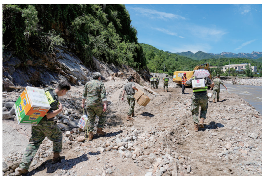
▲在北京市密云区冯家峪镇,救援人员为道路被阻断的村庄运送生活物资(2025年7月30日摄)。2025年7月,北京密云等区遭遇特大暴雨,多个乡镇受灾。