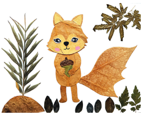
快乐的小松鼠 后小河小学 一年五班 毛羽泽