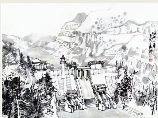
汾河二库(写生) 刘刚绘