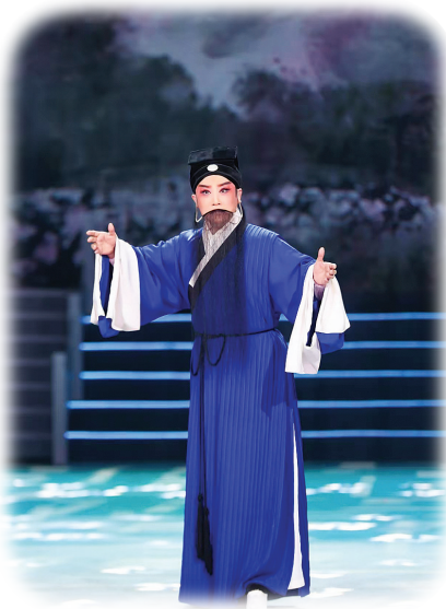
晋剧《烂柯山下·马蹄声声》剧照