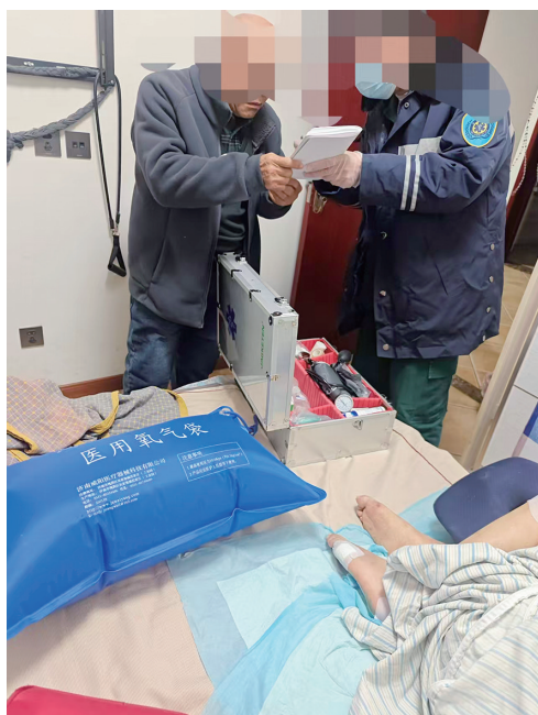
急救人员通过书写向家属了解患者病情