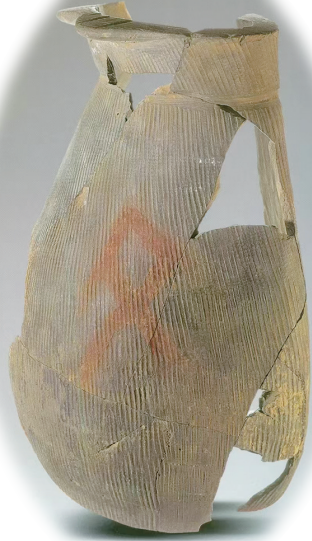
朱书扁壶(陶寺遗址博物馆藏)

最令人动容的，是扁壶沿口的残破处，竟被古人以朱砂细致地涂抹一周。这绝非随意修补，而更像一种庄严的仪式——为残缺赋予意义，为器物注入灵魂。它或许曾是祭司通神的法器，在缭