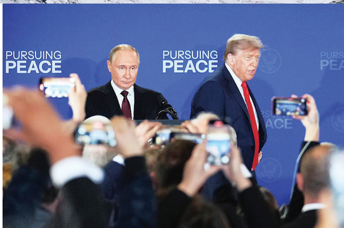
2025年8月15日，美国总统特朗普（后右）与俄罗斯总统普京（后左）在美国阿拉斯加州安克雷奇市埃尔门多夫-理查森联合军事基地举行会晤后共同出席联合记者会。

2025年12月4日，英国和挪威签署一项新防务合作协议，将在格陵兰岛、冰岛以及英国和挪威之间海域联合巡逻，以监视俄海军潜艇动向。俄罗斯驻挪威大使科尔丘诺夫对此回应说，两国针对俄罗斯的军事准备对俄国家安全构成威胁，俄方担忧北约在“高纬度地区”日益增加的存在，正在采取一切措施确保本国安全。