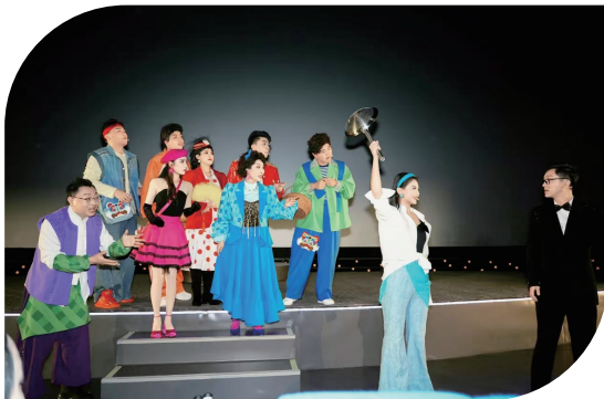
特色文化沉浸式体验项目《太原太有缘》剧照