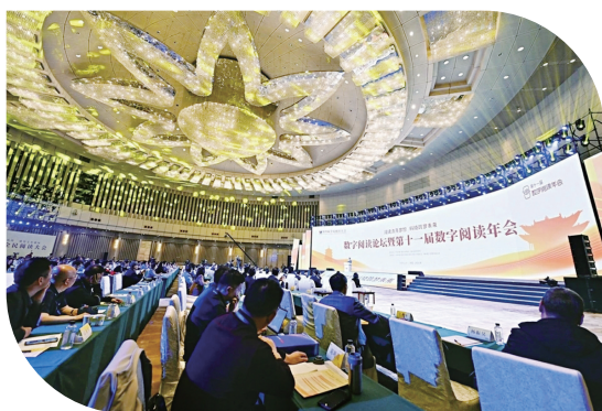
第四届全民阅读大会