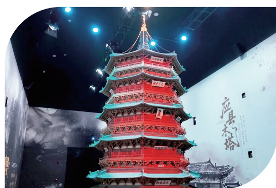
《黑神话:悟空》遇见山西——古建数字艺术展