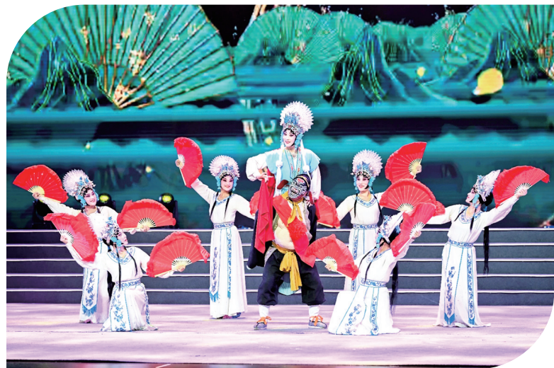
第二届晋剧艺术节耍孩儿《猪八戒背媳妇》剧照

2025年12月12日,特色文化沉浸式体验项目《太原太有缘》在太原首演。该项目首创影院空间与艺术演艺融合的全新模式,致力于打造太原的地标性文旅精品。它依托太原影都地处迎泽区核心商圈的地理优势,通过“影院+沉浸式演艺”的创新业态培育夜间消费场景。不仅能够带动周边餐饮、购物等消费,还将形成“以剧带商、以商哺剧”的文旅经济新模式,为太原的夜经济发展注入强大动力。