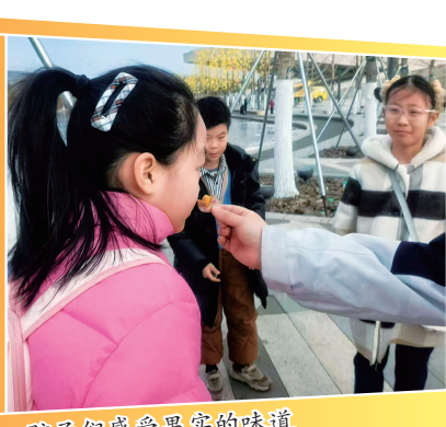
孩子们感受果实的味道