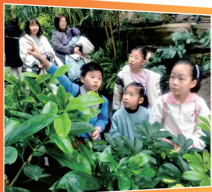
实景课堂认识植物