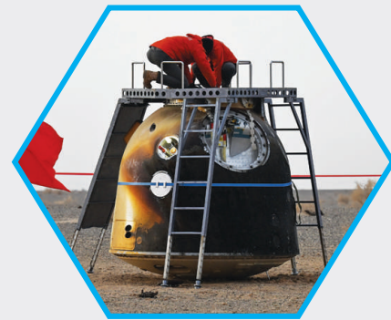
1月19日，神舟二十号飞船安全顺利返回东风着陆场，至此，中国空间站太空应急行动主要任务圆满完成。