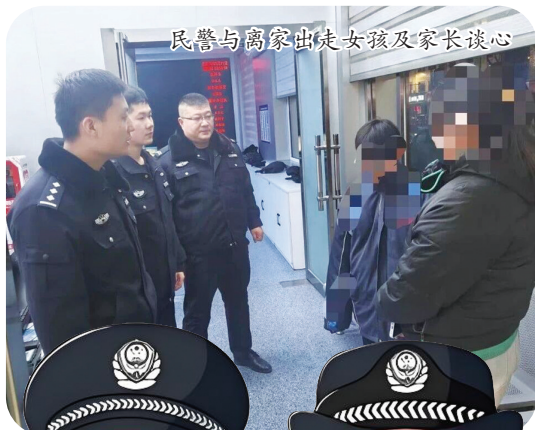
民警与离家出走女孩及家长谈心