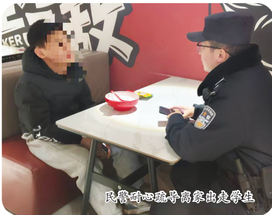
民警耐心疏导离家出走学生

一段时间以来，我市公安机关屡屡接到“孩子离家出走”的求助警情。孩子缘何离家出走？离家出走后怎么处理？警方提醒，家长应注重科学教育与情感陪伴，筑牢预防防线；若孩子出走，请及时报警并提供关键线索。