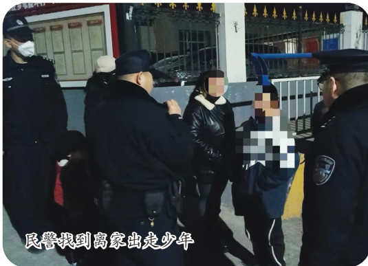
民警找到离家出走少年