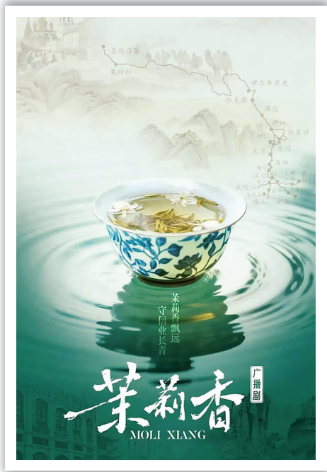
广播剧《茉莉香》海报

该画的价值,不仅在于其对历史场景的还原,更在于其以艺术的方式唤醒民族记忆、传递时代精神。