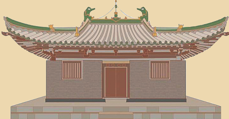
山西平顺天台庵弥陀殿

万佛殿为厅堂式建筑,开间、进深各三间,六架椽,通面宽11.58米,总进深10.78米,平面近正方形。殿顶为单檐九脊歇山式。斗拱硕大华丽,有柱头、柱间和转角三种,其中柱头斗拱高1.85米,超过了柱高的一半,铺作叠架五层七铺作,双抄双下昂,重拱偷心造,繁复之至,实属当时建筑里的最高品位。 据《档案中的山西古建筑》