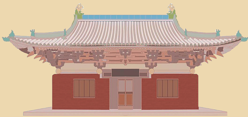
山西平遥镇国寺万佛殿

大云院主殿弥陀殿是建于五代时期的珍贵遗构。面阔三间,进深也是三间,平面布局呈现正方形,这里梁架结构主体为四椽,尤为巧妙的是后殿采用了后乳伏的奇特做法。由于沿袭唐制,这里柱头斗拱为五铺作双抄,耍头被做成了批竹昂的样子。屋顶设琉璃正脊,滴水、垂脊一样俱全,琉璃剪边,形制十分古朴,巍峨雄壮。 韩静