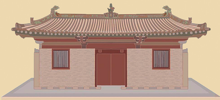
山西平顺龙门寺西配殿

昔日中国四大五代木构为:山西平顺龙门寺西配殿、山西平顺大云院弥陀殿、山西平遥镇国寺万佛殿、河北正定文庙大成殿。近年来,因天台庵弥陀殿维修时发现后唐题记,则合为五座。五座之中,四座都在山西。