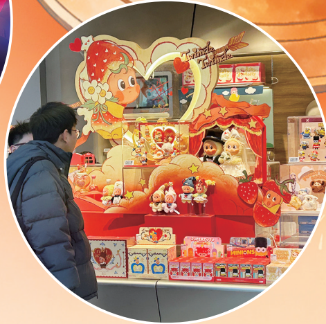
临近春节，悦己消费进入“年货清单”，各类潮玩热销。