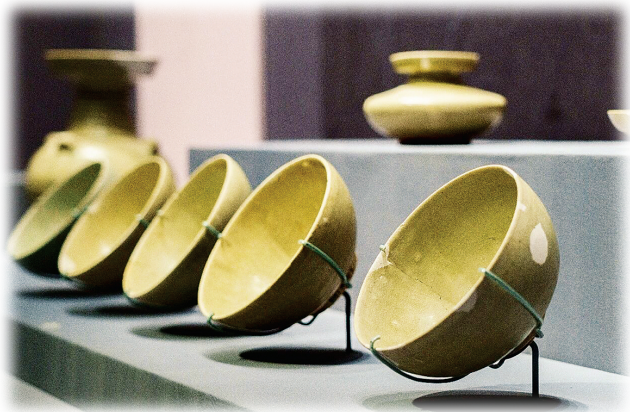
青瓷碗·北魏(山西省考古研究院藏)

汾河之畔，窑火千年未熄。正在山西博物院展出的“北白——白瓷与民族融合”特展，以200余件素瓷珍品为钥，解锁900年文明密码。