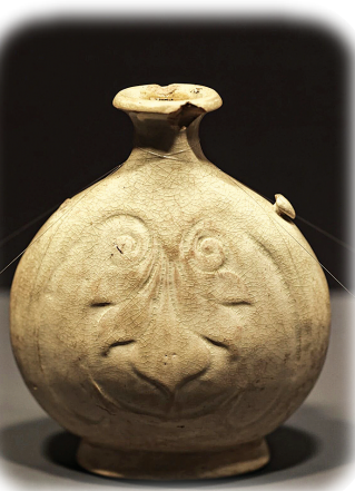
白瓷印花扁壶·唐(西安博物院藏)

窑火渐隐，瓷釉上的印记仍诉说着文明对话。这场特展，是白瓷发展史，更是一部镌刻在瓷胎上的民族融合史诗。