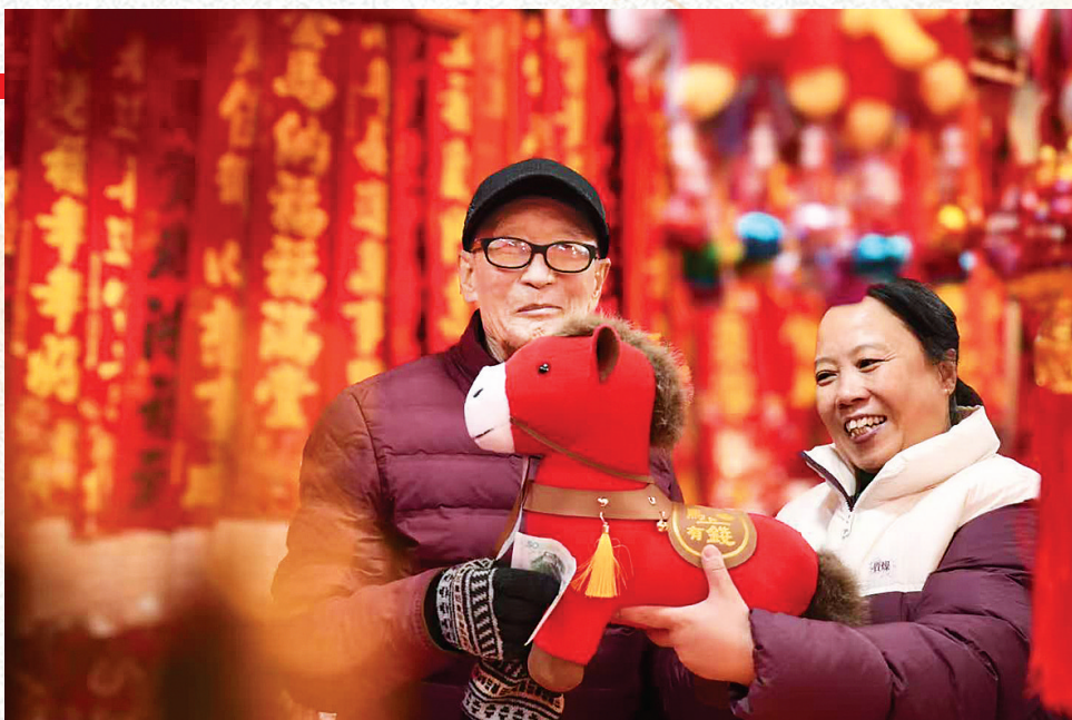
高玉平 摄影作品《马纳安康》