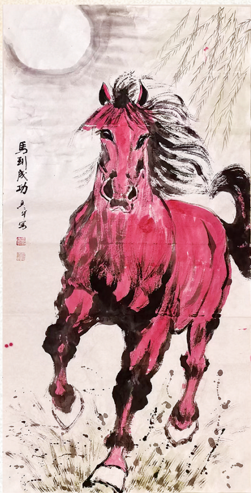
王彦平 绘画作品《马到成功》