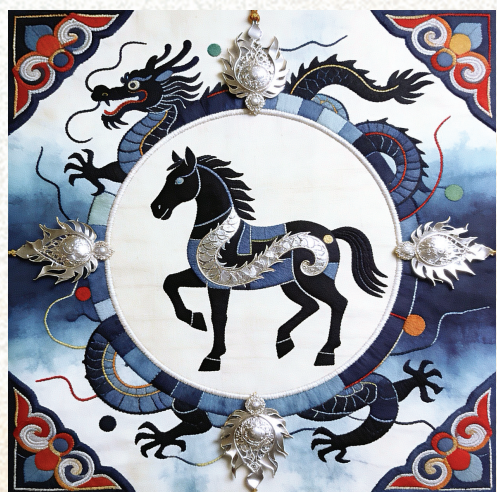
王俊敏 刺绣作品《龙马精神》