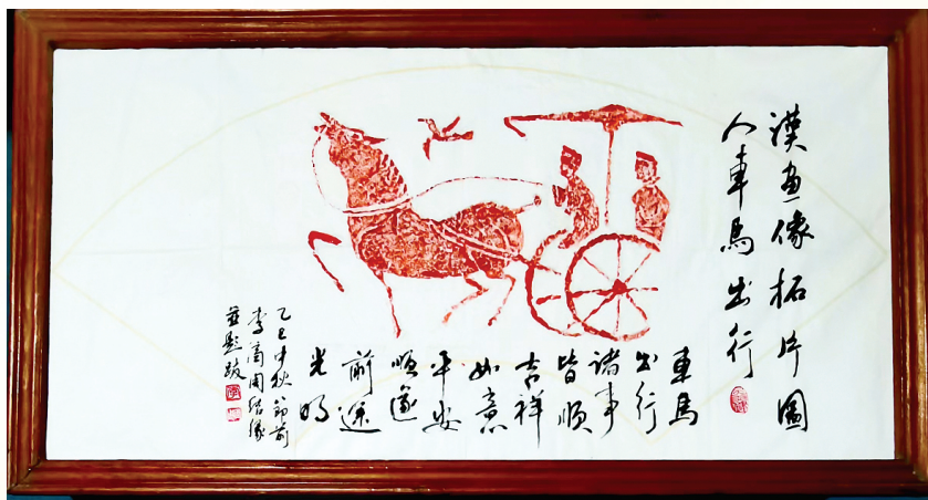
▲李济周 拓片作品《人车马出行图》