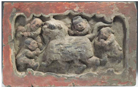
金·社火表演砖雕之舞狮(山西博物院藏)