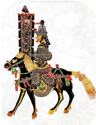
清·皮影骑马人物仪仗

“影舞艺韵”单元则展示了皮影制作的全过程。从选皮、晒皮、刮皮,到描样、刻制、染色,每一道工序都凝聚着艺人