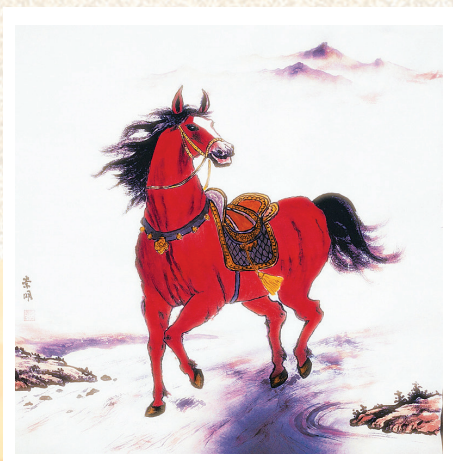
●郝崇明 绘画作品《赤骏凌云图》