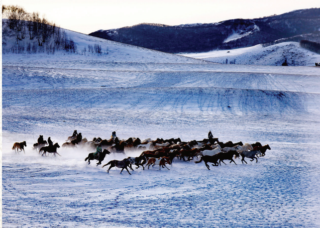
●孙爱琴 摄影作品《骏马驰骋踏雪来》