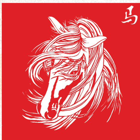
●白晋武 剪纸作品《奔马》