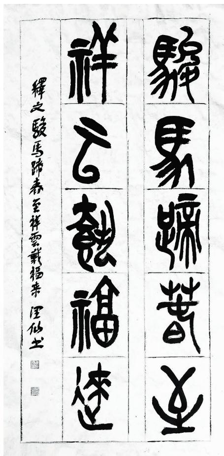
●周润仙 楹联作品《骏马祥云》