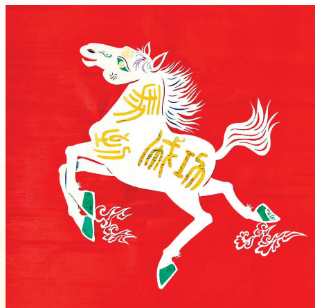
●王闽九 衬色剪纸作品《骏马踏春》