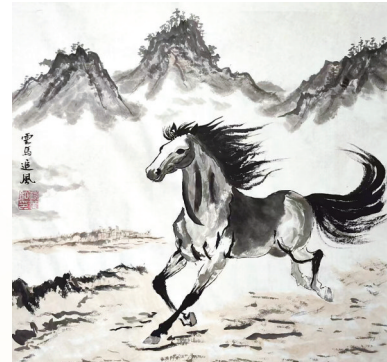
●范华 水墨画《云马追风》