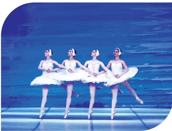
芭蕾舞剧《天鹅湖》剧照

从小听着《天鹅湖》的音乐长大,那些熟悉的旋律曾陪伴我度过无数时光。前些日子的青年宫演艺中心,座无虚席,舞台上天鹅翩翩起舞,台下观众热情洋溢。舞台上上演的是莫斯科芭蕾舞团的《天鹅湖》。观众的掌声,让我深深感受到,这部足尖经典跨越世纪、跨越国界的魅力至今依旧熠熠生辉。它兼具优美的音乐、精湛的舞蹈和动人的剧情,更承载着人类对真善美的永恒追求。于我而言,这场演出不仅是一次视觉与听觉的盛宴,也是一场与青春记忆的温柔重逢。