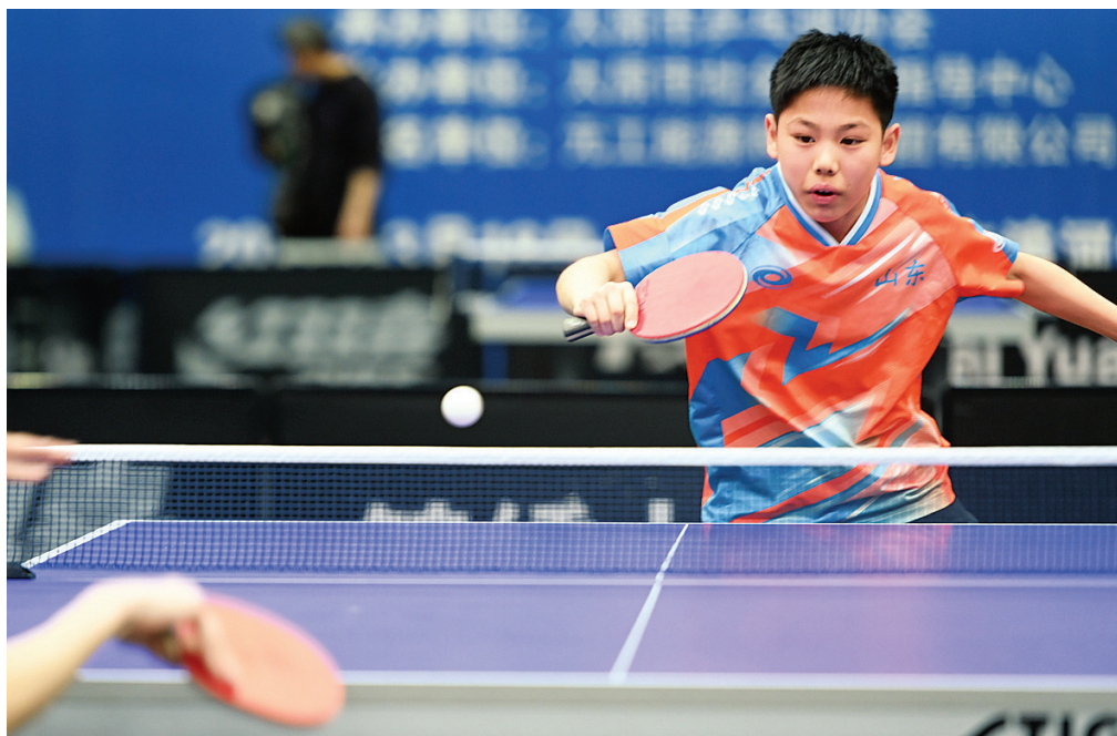
3月24日,由中国乒乓球协会主办的“元工杯”2026年全国少年乒乓球锦标赛(北方赛区)半决赛、决赛在太原滨河体育中心举行,来自全国12个省市自治区的22支代表队参加。

2020年在朔州市注册组建。2022年7月,该俱乐部递补进入五超联赛,成为我省历史上第一支参加五人制超级联赛的球队。最近两个赛季,山西翔宇队将主场设在太原,并顺利完成了保级任务。