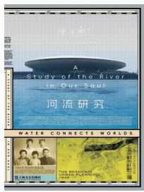
《河流研究》 陈丹燕 著 上海文艺出版社

作家陈丹燕以城市观察者、研究者的视角,用极富文学性的笔触,通过不同身份人物的记忆切入,聚焦黄浦江的前世今生,关注江两岸的变化、城市建设的发展,思索人与江河、江河与城市的相处,写人、写故事、写风景,写一部有些另类的城市、江河史。